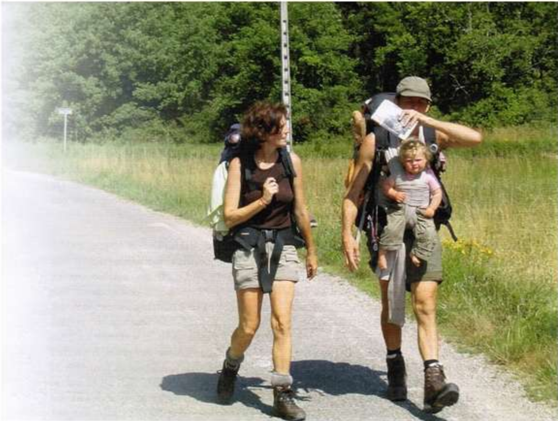
'In de doek zit ze lekker voor zich uit te kijken'.

terwijl ze Mare's blonde kopje krullen nog tussen haar handen hield. Ik antwoordde: 'Elle vient de 'La Hollande' .