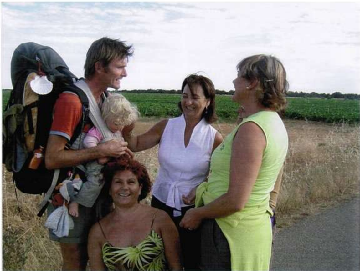
'De Spanjaarden knepen om het hardst in de appelwangen van Mare'.