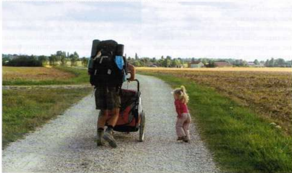
2009, op weg naar Cluny.

Kijk op Mmmtrouwen.blogspot.com voor ons complete reisverslag van de eerste reis en dat van het Duitse ZDF op www.pilgerblog.zdf.de (zie verslag dag 2). Of bestel de dvd: L'enfant du Chemin van Jean François Castell, via Enfantduchemin.free.fr . Of bel Mark Simons en Marianne van Wetter, we helpen je graag op pad: 030-889 40 83.